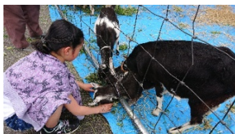
シバヤギ 3 頭

先週 11 日(土)に、当クラブの共催 2 回目、通算 13 回の「あづみ野おなかまキッチン」が開催され ました。前回に引き続き、南安曇農業高等学校イン ターアクトクラブとの共催であり、当日は「ふれあ い動物園」を設営していただき、お子様たちに大変 好評を博していました。