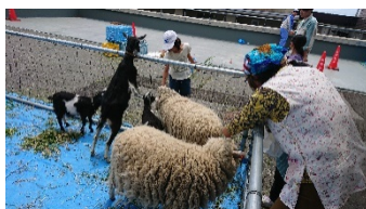
羊コリデール 2 頭

バイキング形式で各々が料理を盛り、ランチョンマ ットを引いて楽しい昼食になります。