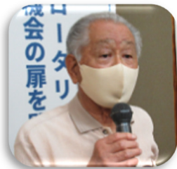
『高木委員長からニコニコBOX報告』