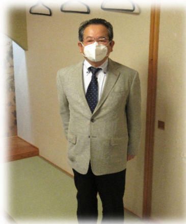
【小穴プログラム委員長】