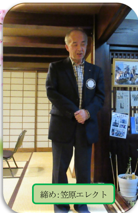
締め:笠原エレクト