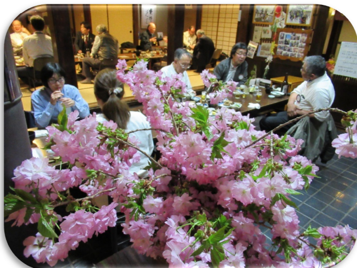
ばんどこさんで綺麗な桜を用意してくださいました