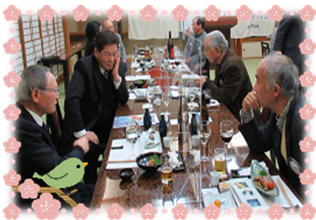
【石田会員・下里会員・高木会員・笠原会員】