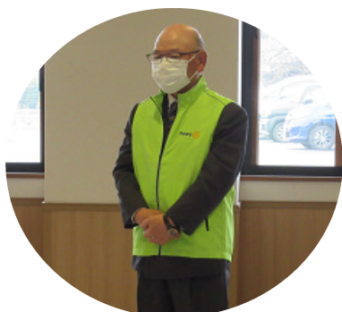
【濱会長より記念品贈呈と挨拶】