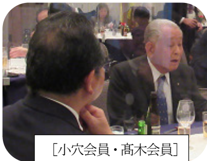
[小穴会員・高木会員]