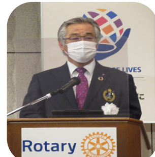
【ガバナー補佐宮尾英明様】