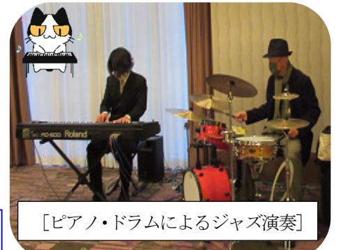
[ピアノ・ドラムによるジャズ演奏]