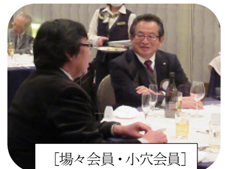
[場々会員・小穴会員]