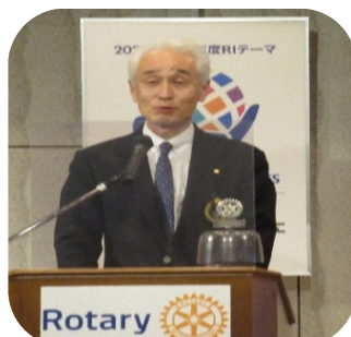
【ガバナー桑澤一郎様】