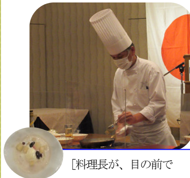
[料理長が、目の前で デザートを作ってくれました。]