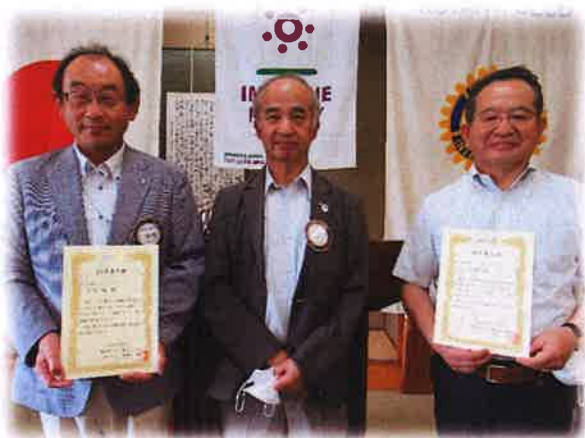
【おめでとうございます】