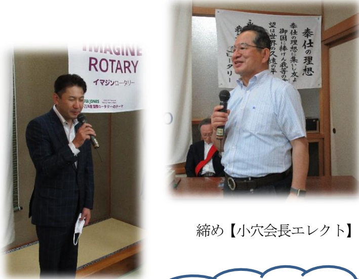
締め【小穴会長エレクト】