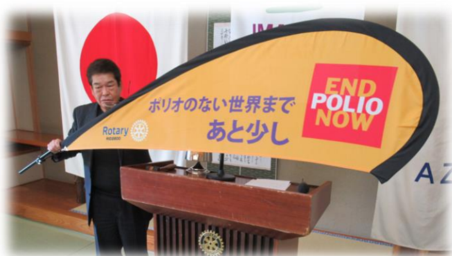
【第2600地区事務所より旗が届きました】

ロータリークラブは 「心の友」、「人」、「信用」、 「感動」、「夢」、「青春」、 「平和」をつくる団体です