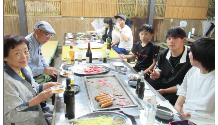
【濱会員 ご家族の皆様】