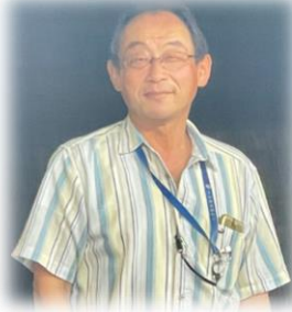
【締め： 三原親睦活動委員長】