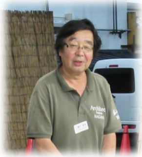
【乾杯： 場々ガバナー補佐】