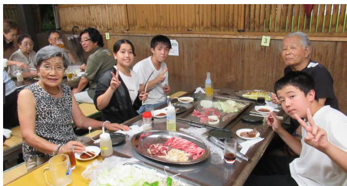
【高木会員 ご家族の皆様】