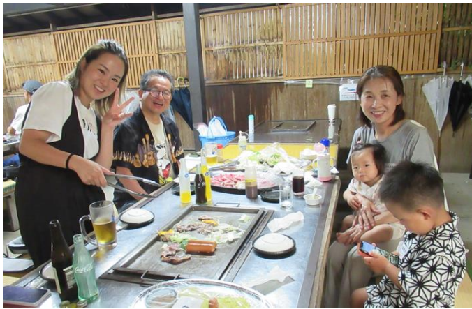
【小穴会長 ご家族の皆様】