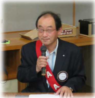
【小穴会長からヤンさんへ奨学金贈呈】