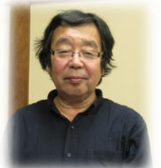
【締め挨拶】 場々ガバナー補佐