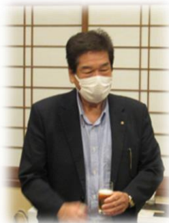
【乾杯挨拶】 下里会員