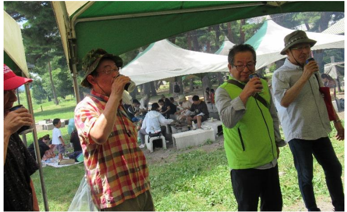
小穴会長 ・ 点鐘