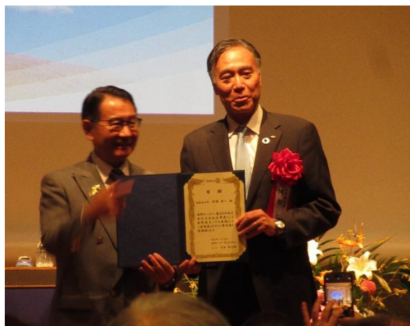
【白鳥敬日瑚ガバナー・長野県知事 阿部守一様】