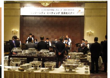
アトラクション 楽団ケ・セラ