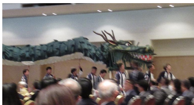
【記念アトラクション】