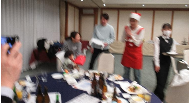
サンタさんからのプレゼント